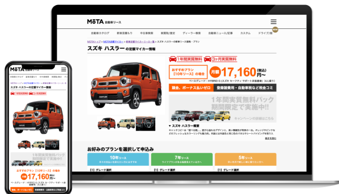
検索結果一覧ページ イメージ